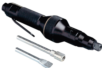
Sűrített levegős salakoló kalapács

Fedett ívű hegesztéssel készült, nehezen salakolható varrat tisztítása sűrített levegős kalapáccsal.