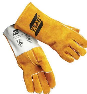
„A” típusú hegesztő kesztyű az MSZ EN 12477 szerint.

A salakolás kollektív védőeszközeinek feladata, hogy megfelelő védelmet nyújtsanak a munkavégzés hatókörében tartózkodó személyeknek. A kollektív védelem eszközei lehetnek például mozgatható vagy fix paravánok, függönyök. Ha a