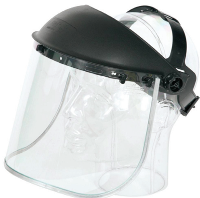
Egyszerű arcvédő pajzs salakoláshoz

Salakoláshoz elsősorban az arc és a szem védelmét ellátni képes egyéni védőeszközök viselését kell előírni és megkövetelni.