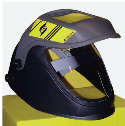
Hegesztéshez is alkalmas kombinált arcvédő pajzs

védőeszköz megválasztásánál célszerű kombinált védőeszközt alkalmazni, mint amilyen az alábbi ábrán látható.